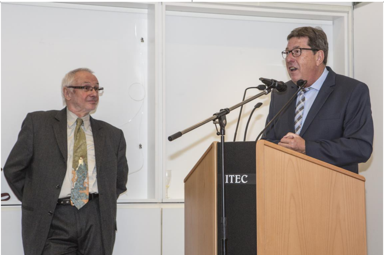
Bürgermeister Windhorst eröffnet vor gut 70 Gästen.